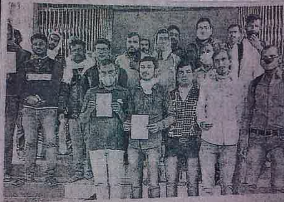
नौकरी के लिए नियोजनालय पहुंचते युवक • जागरण

13 हजार युवतियों और तीन थर्ड जॉडर ने भी रोजगार के लिए कर रखा है आवेदन